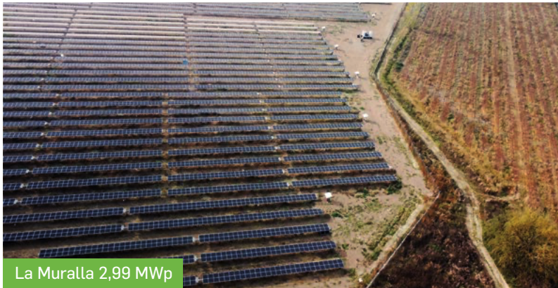
La Muralla 2,99 MWp