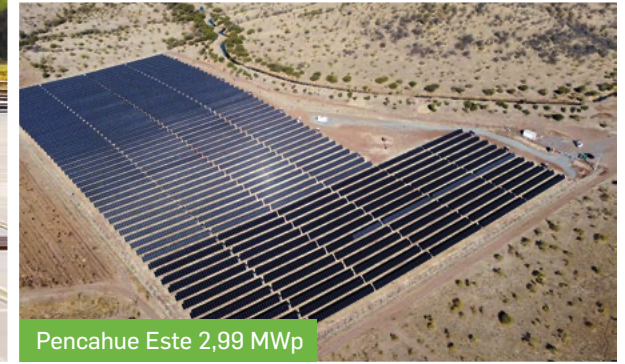
Pencahue Este 2,99 MWp