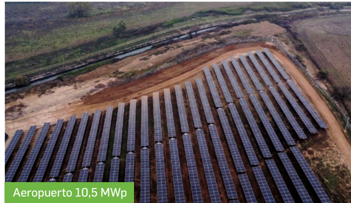
Aeropuerto 10,5 MWp