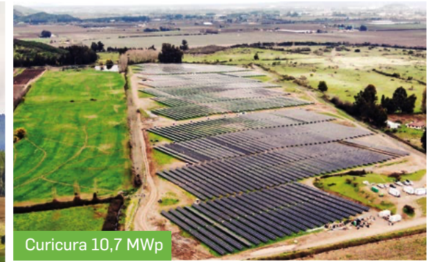
Curicura 10,7 MWp