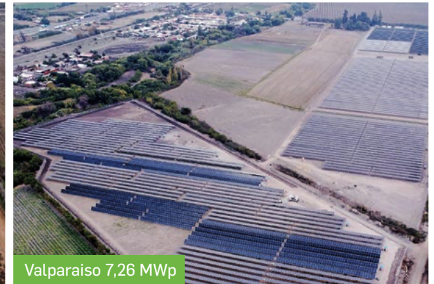
Valparaiso 7,26 MWp