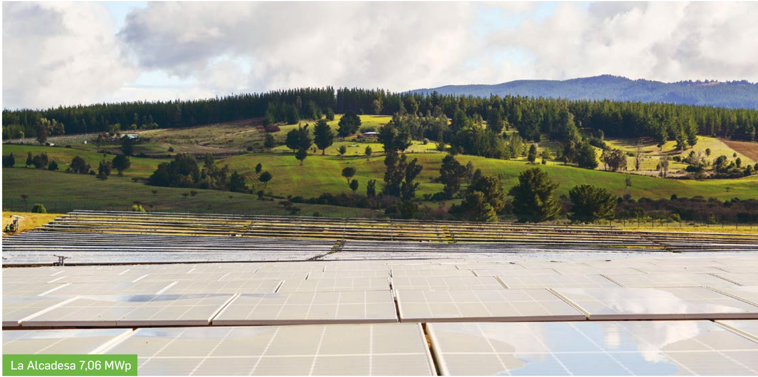
La Alcaidesa 7,06 MWp