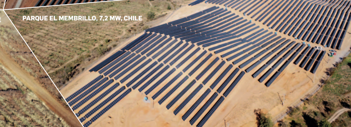
PARQUE EL MEMBRILLO, 7,2 MW, CHILE

Tento dokument je určen výhradně pro informační a propagační účely a není nabídkou, výzvou či doporučením k investování. Před investičním rozhodnutím je nutné se seznámit se zněním statutu fondu. Investování s sebou nese riziko, které může vést k poklesu hodnoty investice a kapitálové ztrátě. Hodnota investičních akcií se v čase mění a historické výsledky fondu nejsou indikací ani zárukou výsledků budoucích. Investice do fondu podléhají rizikům uvedeným ve statutu fondu. Informace obsažené v tomto dokumentu byly připraveny s maximální péčí, mohou však být předmětem změn a aktualizací a fond ani obhospodařovatel neposkytují záruku ohledně jejich správnosti či úplnosti. Zdanění fondu je stanoveno zákonem a může být při změně zákona upraveno.