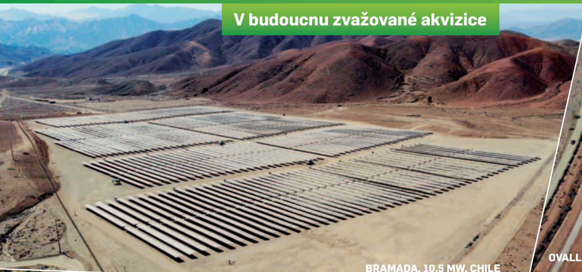
BRAMADA, 10,5 MW, CHILE