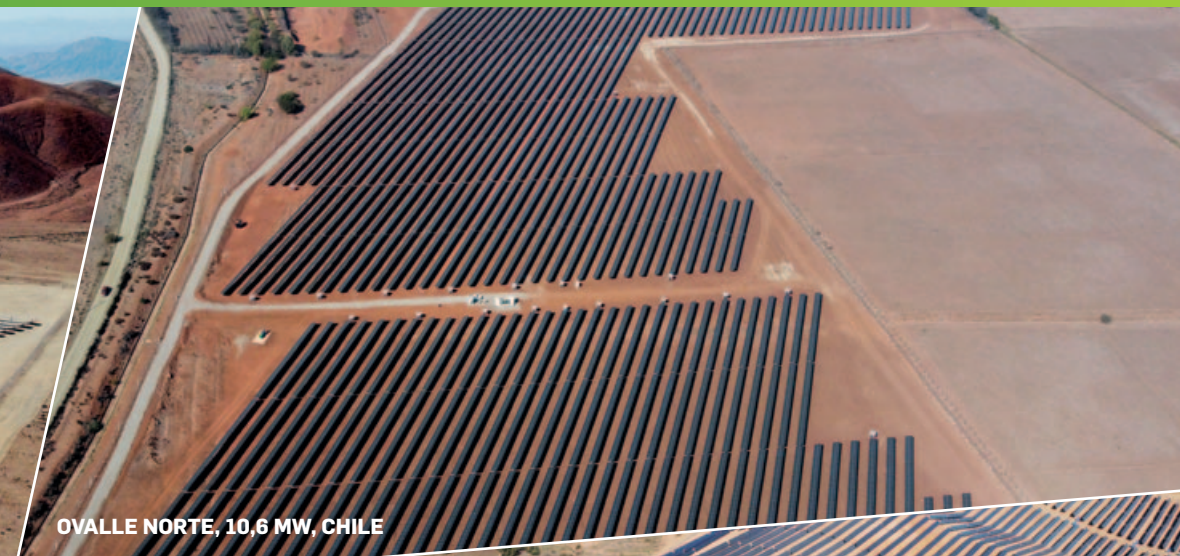
OVALLE NORTE, 10,6 MW, CHILE